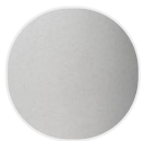
Pietra ricostituita X084