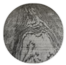
Legno carbonizzato X094