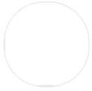
Solid surface bianco 3mm X035